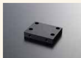
材質/アルミ黒アルマイト