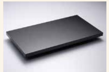
材質/黒御影石 サイズ/700W×400D×30H 重量/30kg 型式/LPB1 価格/¥78,000 (税抜)