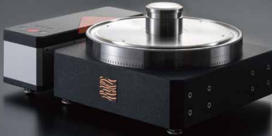
エアフロートターンテーブル